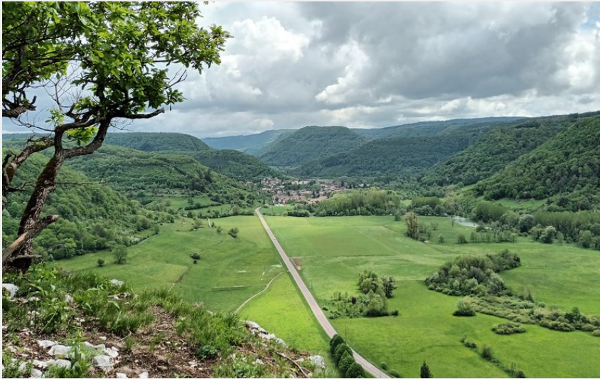
Ornans, Roche Lahier