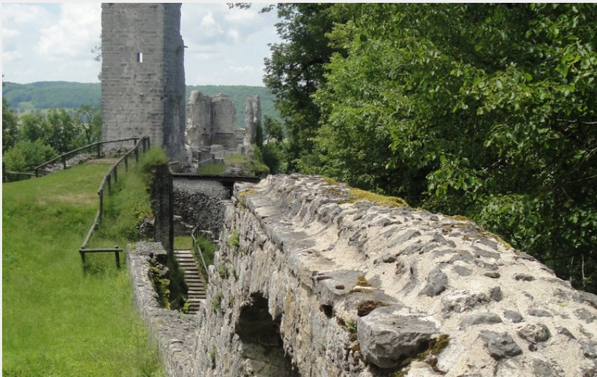
Castel Saint-Denis